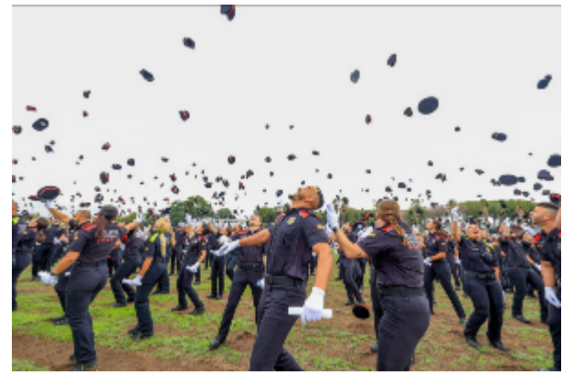
El nou policies a la seva graduació