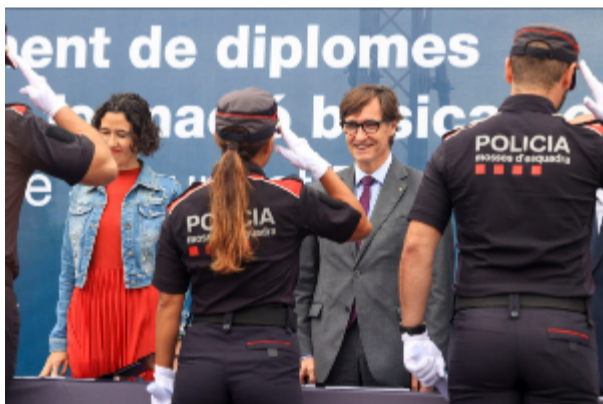
El president Illa i la consellera Parlon a l'acte de graduació de nous policies

El cap de l'Executiu, que ha encapçalat l'acte, acompanyat de la consellera d'Interior i Seguretat Pública, Núria Parlon, ha deixat clar als nous policies que la tasca que desenvoluparan "fonamenta la convivència, la justícia i l'equitat que volem per a Catalunya" i, per aquest motiu, els ha dit, "no puc imaginar aquesta Catalunya sense la vostra feina, sense la vostra dedicació" .