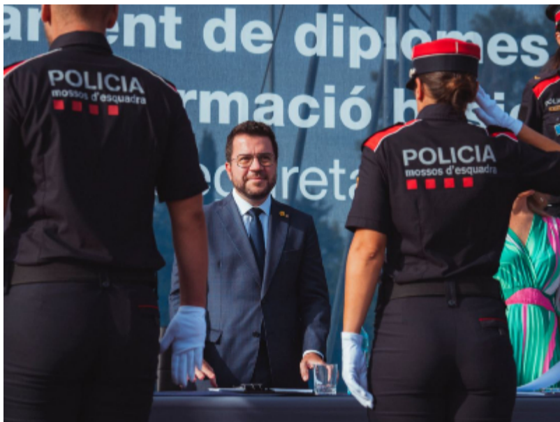
El president saluda una de les policies graduades.

El president de la Generalitat, Pere Aragonès i Garcia, ha encapçalat aquest matí l'acte de cloenda i lliurament de diplomes de la 36a promoció del Curs de formació bàsica per a policies.