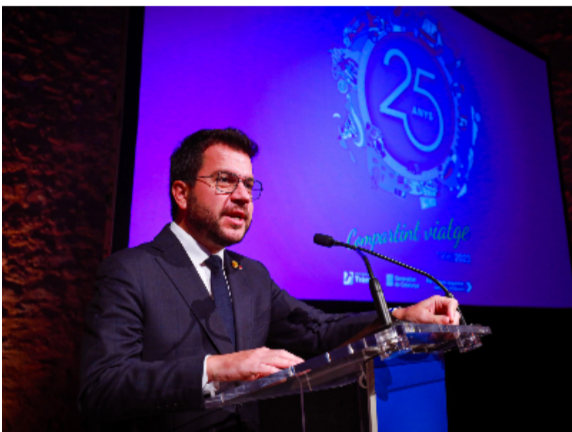
El president, durant la seva intervenció en l'acte

El president de la Generalitat, Pere Aragonès, ha destacat aquesta tarda la importància de la creació, fa 25 anys, del Servei Català de Trànsit, que va ser "una fita històrica del cos de Mossos d'Esquadra en el seu avenç com a policia integral de Catalunya" . I ha reivindicat la feina feta per aquest servei, assegurant que "hem demostrat la capacitat de governar-nos a nosaltres mateixos com a país en un àmbit extremadament sensible" .