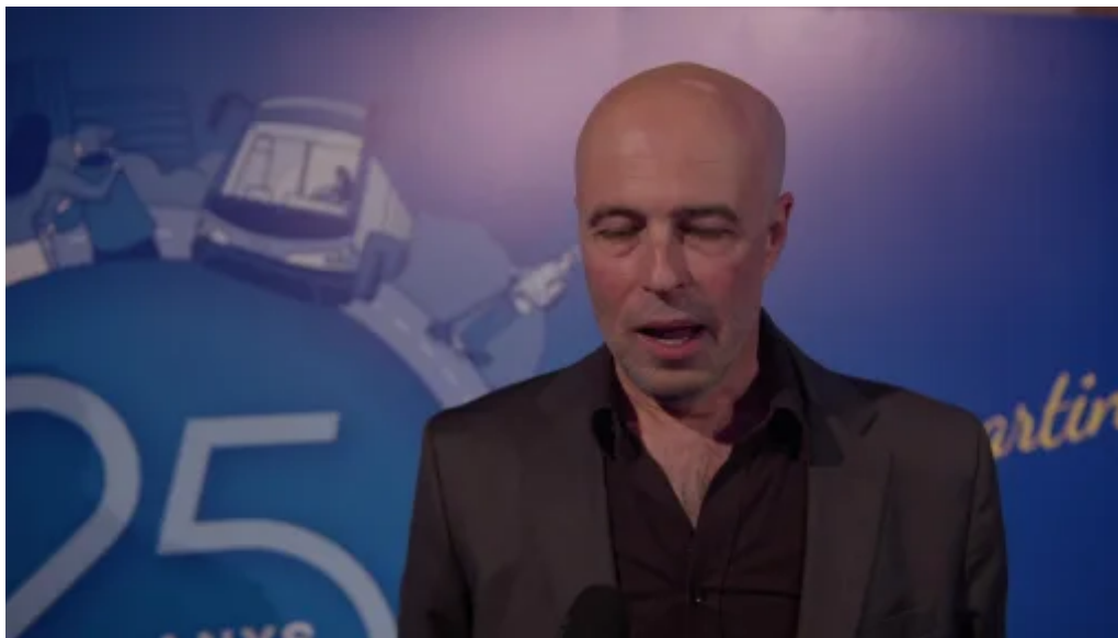
Acto conmemorativo #SCT25anys: equipo humano