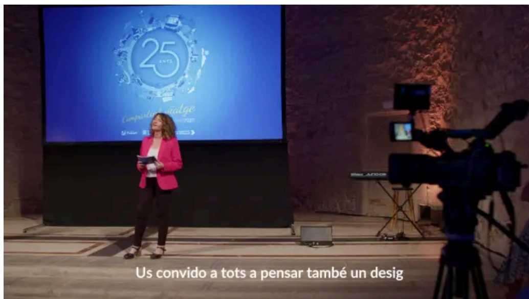
Acto conmemorativo #SCT25anys: deseos