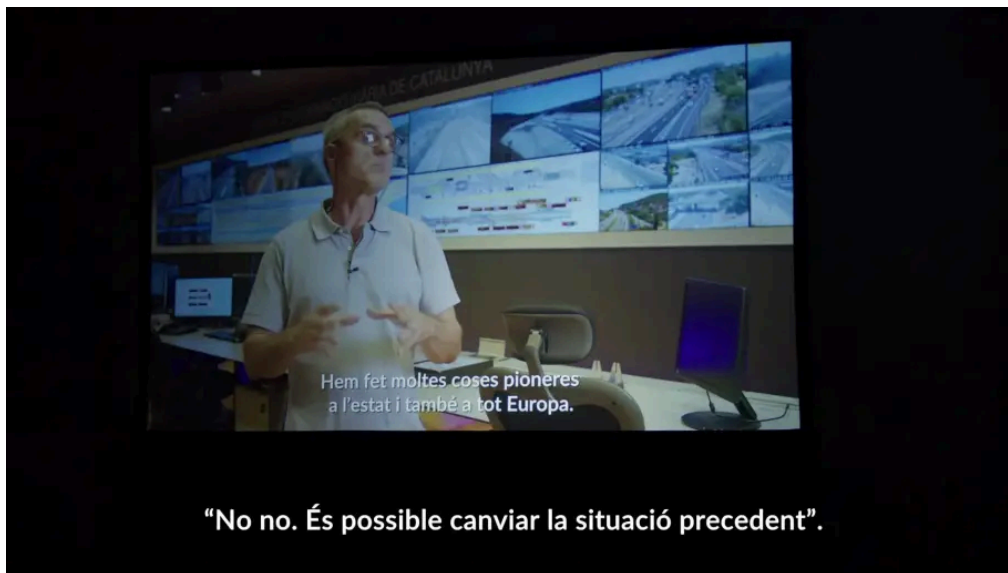
Acto conmemorativo #SCT25anys: declaraciones institucionales