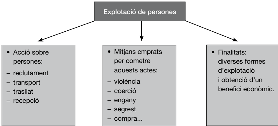
Figura 2. Components de la definició de l'exploració de persones.

Són dignes de menció diversos aspectes de la definició per les ramificacions que presenten a l'efecte d'intervenció: