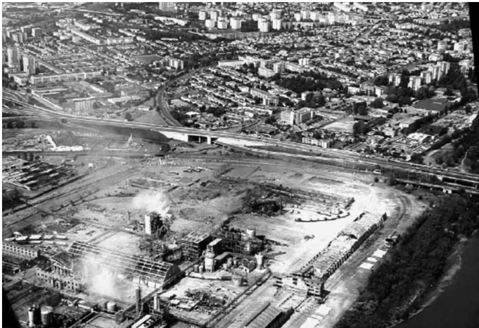
Imatge 6. Estat de l'empresa AZF i la ciutat veïna de Tolosa (Dechy et al. , 2004).