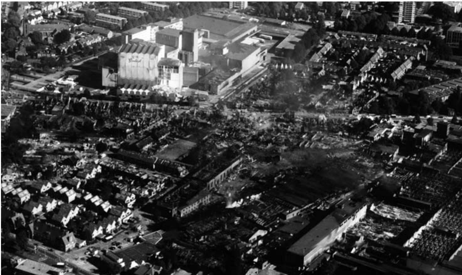
Imatge 4. Vista de la catàstrofe d'Enschede.

L'incident va començar amb un petit incendi dins les instal·lacions de SE-Fireworks Company que va donar lloc a una sèrie d'explosions que van provocar una explosió de gran potència. Les primeres explosions dels focs artificials van atraure un nombre elevat de públic als carrers de la ciutat. Aquesta va ser, més tard, la causa d'algunes morts addicionals degudes a la curiositat de la població, però al mateix temps va salvar la vida de les persones que d'altra manera haguessin mort sota els edificis esfondrats per l'explosió final. En total van morir vint-i-dues persones, més de nou-cents seixanta van resultar ferides i més de sis-cen-