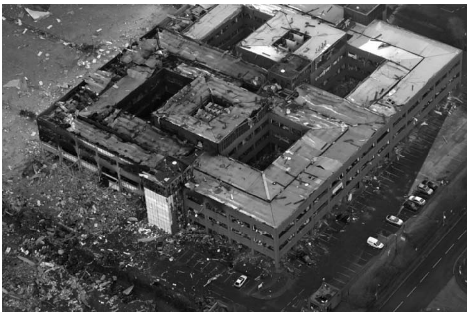
Imatge 3. Zona afectada de Buncefield (Buncefield Major Incident Investigation Board, 2008).