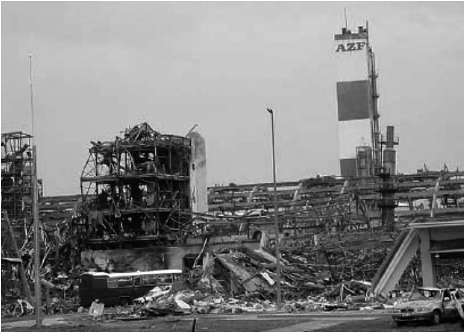
Imatge 5. Vista de la planta química AZF després de l'explosió (Taveau, 2010).