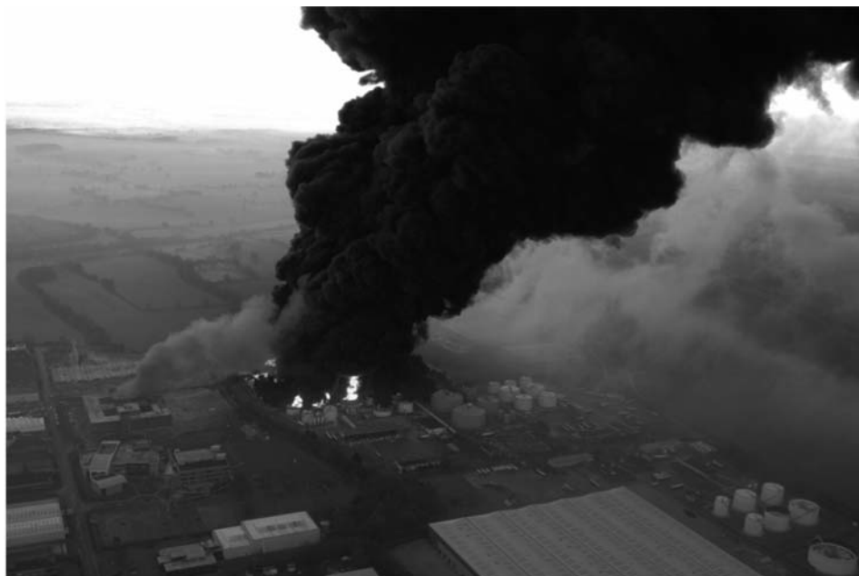
Imatge 2. Instal·lació de Buncefield el dia que es va iniciar l'incendi (Buncefield Major Incident Investigation Board, 2008).