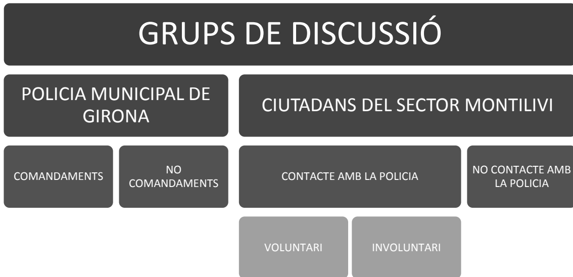
Quadre 6.

En conclusió, els grups de discussió quedarien dividits de la següent manera: